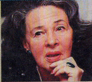
Алла Гербер, президент фонда “Холокост”, писатель:

– Когда я был еще мальчиком, я ощущал, что лучше евреем не быть. Потому что временами мне давали понять – еврей хуже всех остальных людей. А почему хуже? Да просто потому, что он еврей! Я не помню, кто первым дал мне это ощущение, – был тогда просто маленьким ребенком, но чувствовал это очень остро. Вот для вас это простое интервью, а для меня это жизнь. Больше мне нечего добавив.